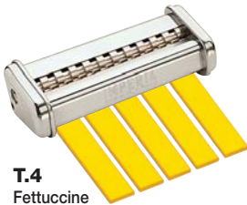
T.4 Fettuccine mm. 6,5