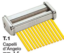
T.1 Capelli d'Angelo mm. 1,5