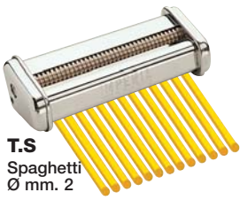
T.S Spaghetti Ø mm. 2