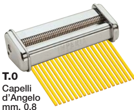
T.0 Capelli d'Angelo mm. 0,8