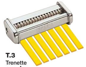
T.3 Trenette mm. 4