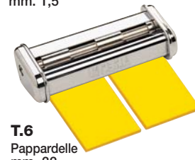
T.6 Pappardelle mm. 32