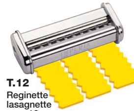
T.12 Reginette lasagnette mm. 12