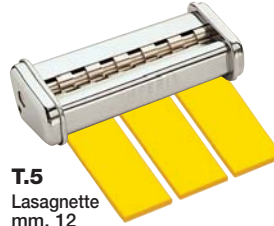
T.5 Lasagnette mm. 12