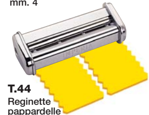
T.44 Reginette pappardelle mm. 44